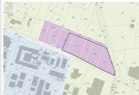
Foglio: 66 - Mappali: 283p, 291p, 294p, 300p, 312p