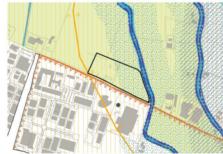
P7.1_Tutele paesaggistico - ambientali